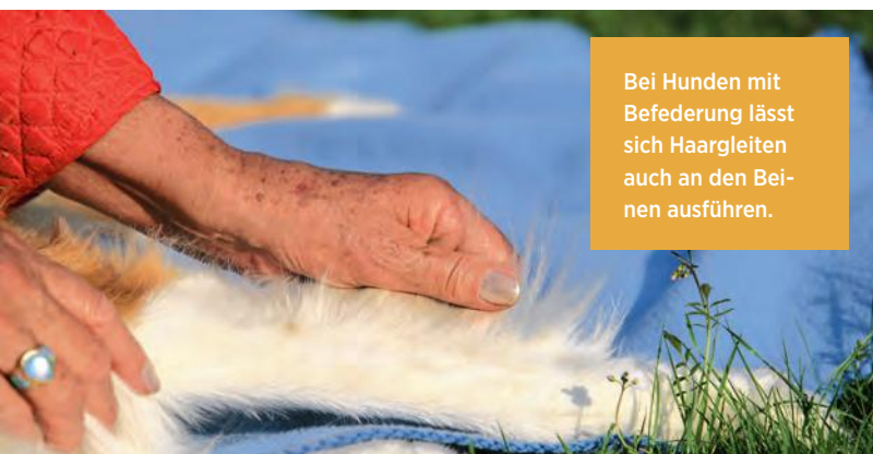
Bei Hunden mit Befederung lässt sich Haargleiten auch an den Beinen ausführen.

diesem Fall den Säugling, richten, sondern auch andere Familienmitglieder und fremde Artgenossen betreffen können. Mangelnde Zuneigungsbekundungen vermögen Aggressionen auszulösen und das muss unter allen Umständen verhindert werden. Wer möchte schon, dass Menschen gebissen oder ahnungslose Vierbeiner in Raufereien verwickelt werden?