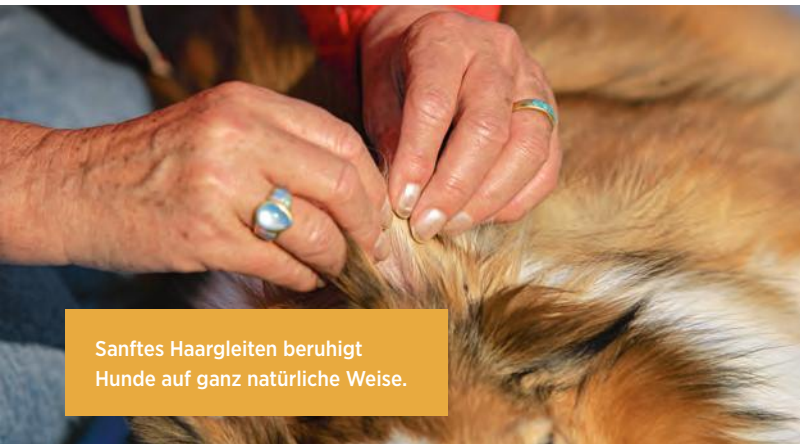
Sanftes Haargleiten beruhigt Hunde auf ganz natürliche Weise.