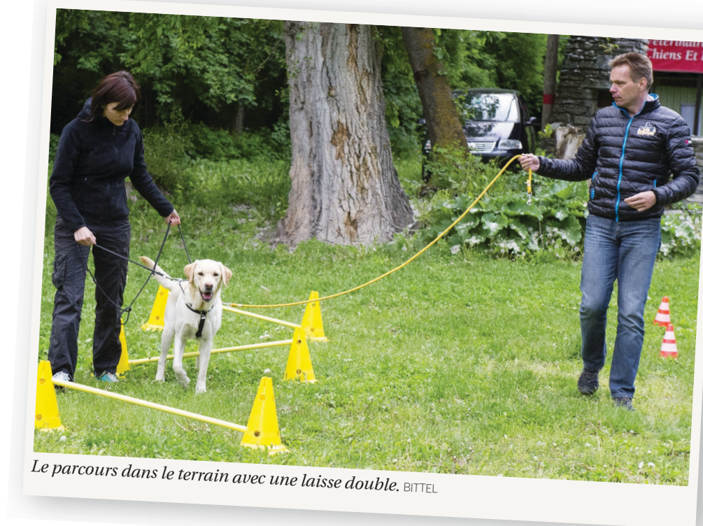
Le parcours dans le terrain avec une laisse double. BITTEL

La formation est aussi destinée aux chiens à problèmes, aux chiens agressifs: «Plus un chien est craintif, plus il devient agressif. Les personnes